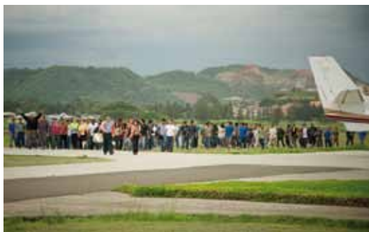
Slechts een paar procent van de migranten bereikt de VS voor een leven als illegale werkracht. De anderen worden opgepakt en teruggestuurd. Ze komen ontgoocheld, beschadigd, beroofd en gewond terug. Als ze de reis tenminste hebben overleefd.

Ons vastenproject is gericht op deze laatste groep, de